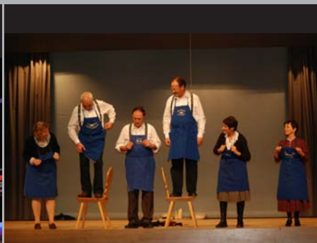
WAS UNS GROSS UND STARK GEMACHT HAT