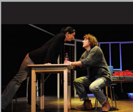
MIT DER LIEBE BESESSEN