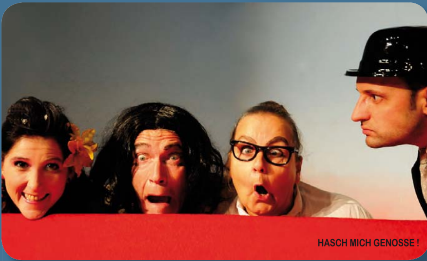
HASCH MICH GENOSSE!