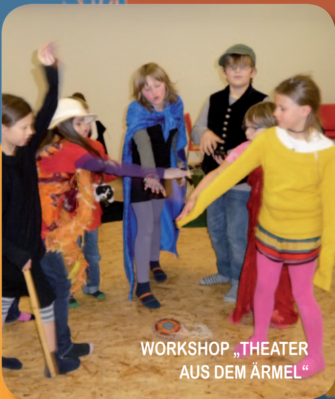
WORKSHOP „THEATER AUS DEM ÄRMEL“