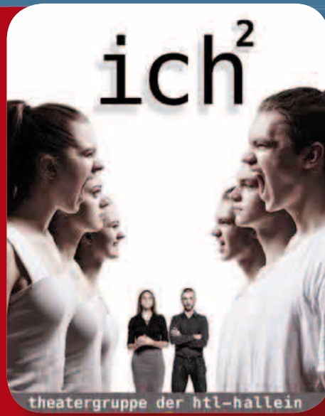
ICH² - herausragendes Jugendtheater der Gruppe „Old School Workshop“, Hallein 2015