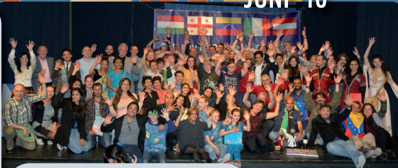
11 Nationen aus drei Kontinenten auf der Bühne in Abtenau.

Eva aus Ungarn: „...Das Erlebnis dieses Festivals hat uns noch etwas sehr wichtiges gezeigt. Nämlich, dass Solidarität und Menschlichkeit in Abtenau charakteristisch sind. Wir haben gespürt, dass diese nicht nur ein Teil des Festivals sind, sondern ein Teil Eures Alltags... Es war das schönste Festival, das wir bisher erlebt haben...“