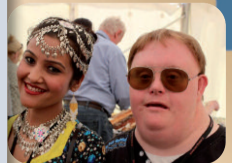
Eine zu Herzen gehende Freundschaft aus Nepal und Deutschland.